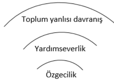
Şekil 1: Özgecilik, Yardımseverlik ve Toplum Yanlısı Davranış Arasındaki İlişki

Ayrıca yardım etme davranışının altında yatan motivasyon özgeci davranışı yardım davranışından ayıran en önemli unsurdur (Kağıtçıbaşı ve Cemalcılar, 2014, 243). Yani sonuç değil, sebep önemlidir. Tamamen mağdurun ıstırabını hafifletme gereği ile motive olmuş biri, eylemlerinin sonucunda ödül almış olabilir ancak o ödülü alma beklentisiyle harekete geçmediyse bu davranış özgecidir (Bordens ve Horowitz, 2001, 408). Ancak çoğu zaman toplum yanlısı davranışların ardındaki nedenleri tespit etmek zordur ve bu yüzden toplum yanlısı davranışların özgeci olup olmadığını bilmek güçtür (Esienberg, 2003, 6). Dolayısıyla arkasındaki nedenler ve motivasyon doğrudan gözlenemeyeceği için sosyal-bilişsel süreçler önem kazanır (Schroeder ve Graziano, 2015, 9). Özgecilik, yardımseverlik ve toplum yanlısı davranış arasındaki ilişki Şekil 1'deki gibi gösterilebilir.